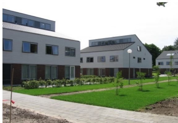
Horizon Rotterdam.

Om te zorgen dat zo weinig mogelijk kinderen onterecht in een jji zitten, wordt landelijk de Wet op de jeugdzorg per 1 januari 2008 veranderd. De gesloten opvang wordt dan officieel van kracht en is daarmee een oplossing voor het probleem dat jeugdigen onterecht vast zitten. De gesloten behandeling is een alternatieve vorm van jeugdzorg, waar al positieve proefprojecten mee zijn gehouden, zoals de projecten 'Hand in Hand' van Horizon en Harreveld en 'De Juiste Hulp' van de Hoenderloo Groep. Beide zijn voor jongeren van 12 jaar en ouder.